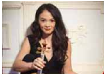
BAROCKVIOLINISTIN MIDORI SEILER