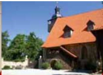
TRAUKIRCHE JOHANN SEBASTIAN BACHS IN DORNHEIM