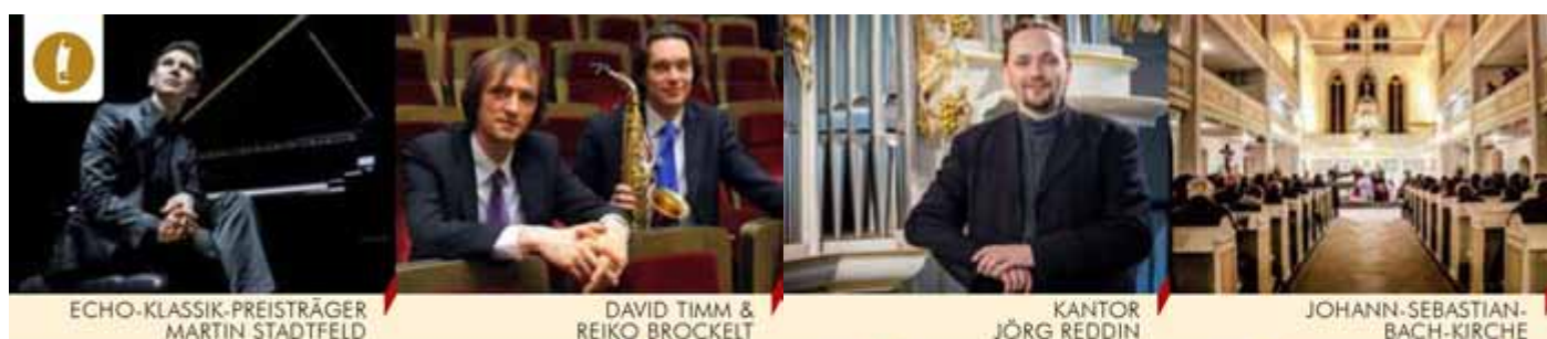
ECHO-KLASSIK-PREISTRÄGER MARTIN STADTFELD

Die Karten zu den Veranstaltungen sind in der Tourist-Information, Markt 1, 99310 Arnstadt, Tel.: 036 28 / 60 20 49 (Fax: 66 18 47), E-Mail: information@arnstadt.de , sowie unter www.bach-festival.de/tickets erhältlich.