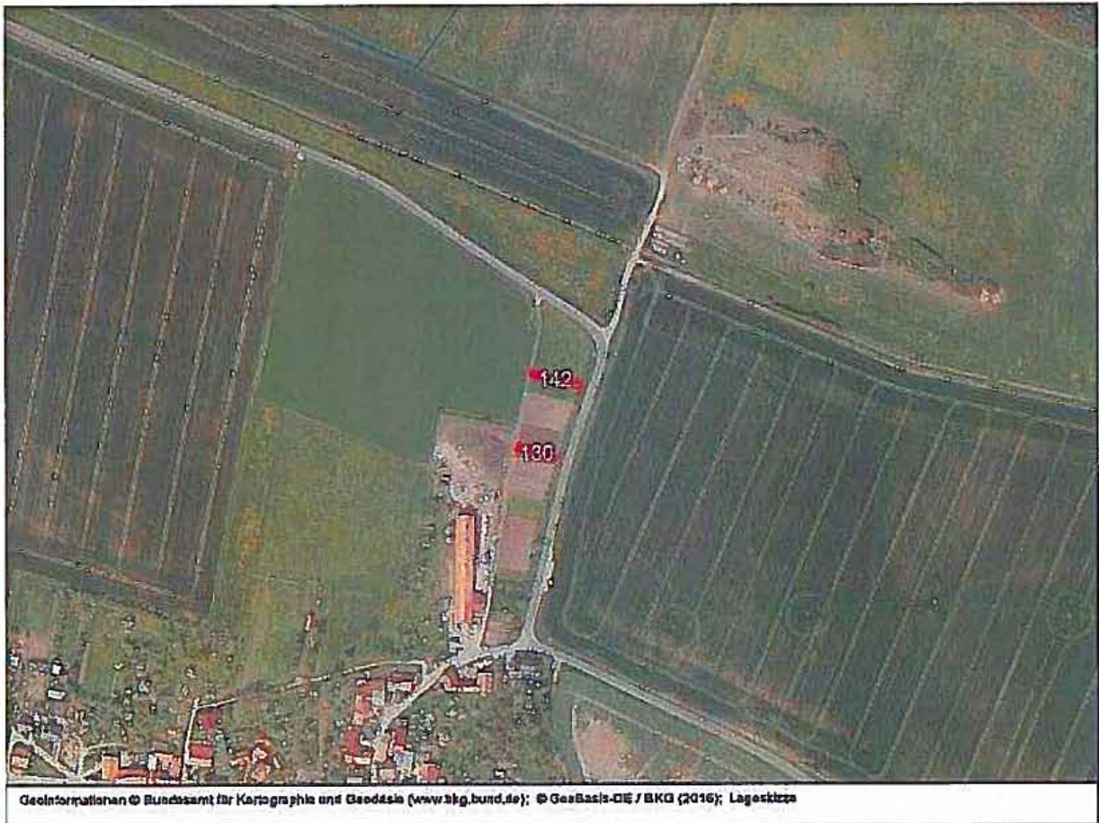
Geoinformationen © Bundesamt für Kartographie und Geodäsie ( www.bkg.bund.de ); © GeoBasis-DE / BKG (2016); Lagestizza