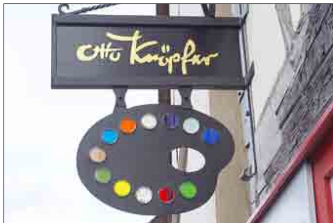
Der neue Museumsausleger mit originalem Knöpfer-Namenszug