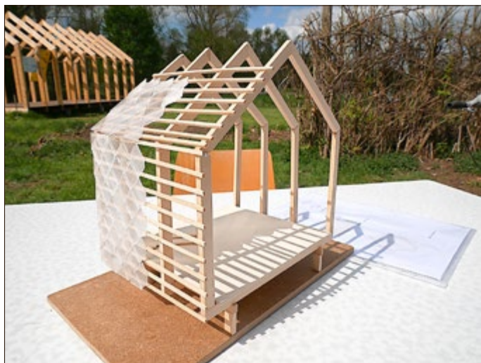
Modell des Lehrbienenstandes