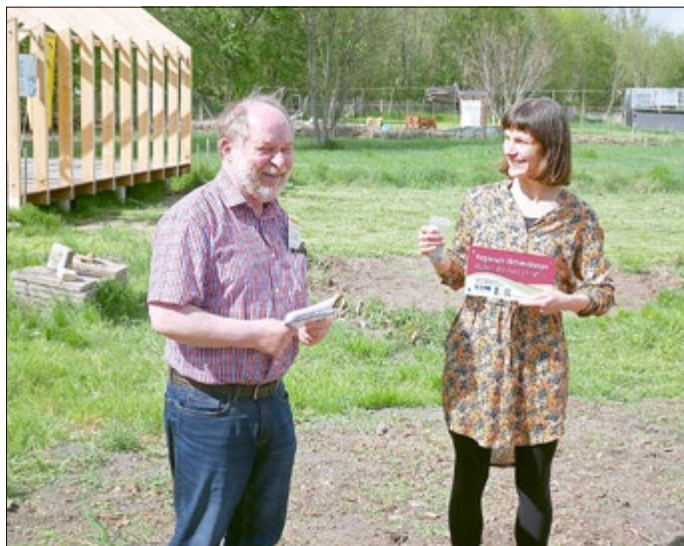
Förderplakettenübergabe durch den RAG-Vorsitzenden