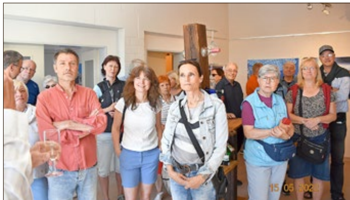
Interessierte bei der Ausstellungsführung