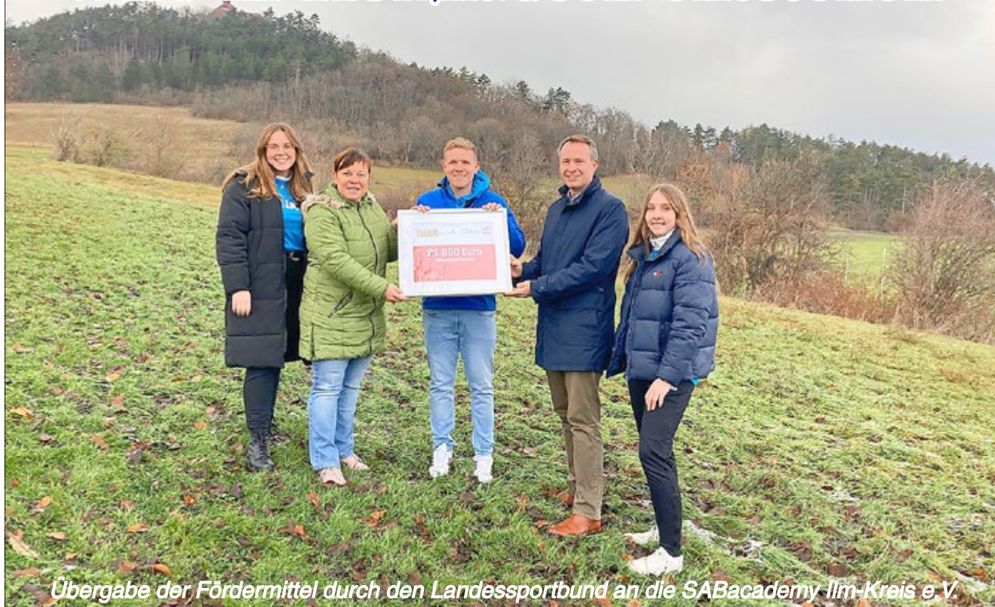
Übergabe der Fördermittel durch den Landessportbund an die SABacademy IIm-Kreis e.V.