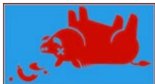
Graphik: SMS Sachsen

Die Afrikanische Schweinepest löst sehr schwere, aber unspezifische Symptome aus. Diese können unter anderem Fieber, Aborte und Atemprobleme bis hin zu Blutungen aus Nase und After umfassen. Das Virus ist sehr aggressiv und führt fast immer zum Tod des erkrankten Tieres innerhalb einer Woche. Es handelt sich bei der ASP um eine anzeigepflichtige Tierseuche, das