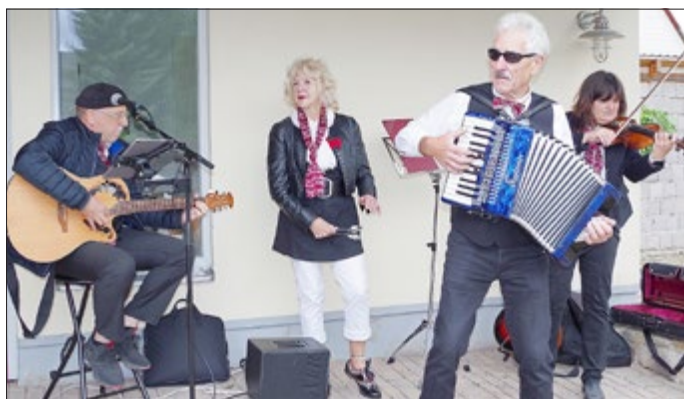
Die „Musicfriends“ spielten auf