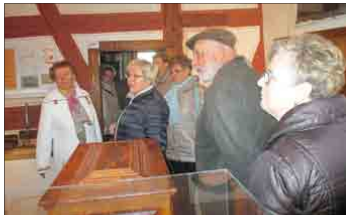
Viel Interessantes gab es im Heimatmuseum zu sehen.