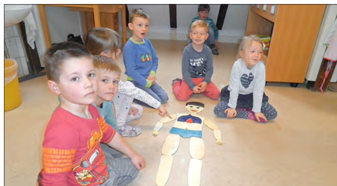
Kinder setzten aus Puzzleteilen den menschlichen Körper zusammen und benennen diese