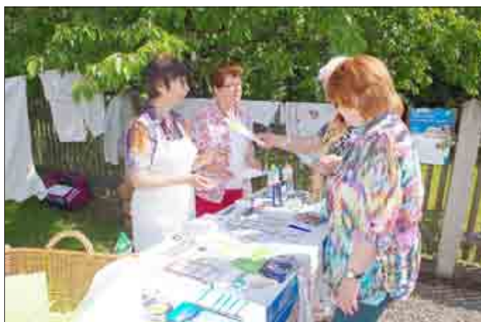
Am Wäschestand der Landfrauen