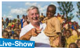
Live-Show mit Reiner Meutsch